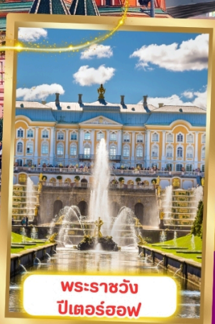
พระราชวัง ปีเตอร์ฮอฟ