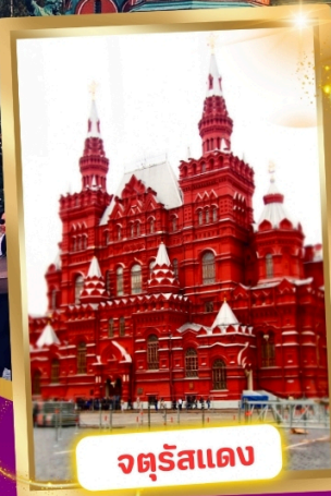
จตุรัสแดง