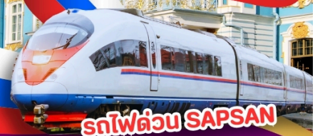
รถไฟด่วน SAPSAN