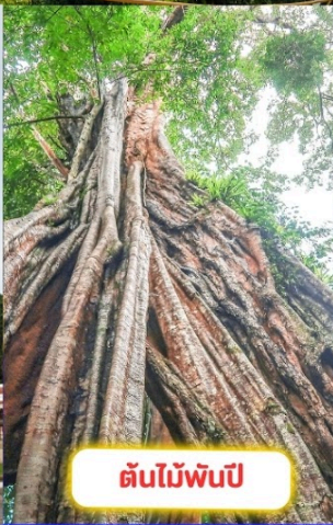
ต้นไม้พันปี