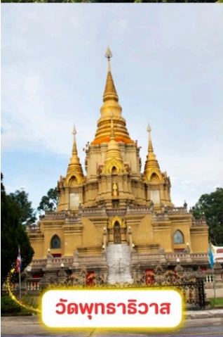
วัดพุทธาธิวาส