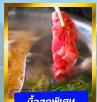
ม้อสดพิเศษ