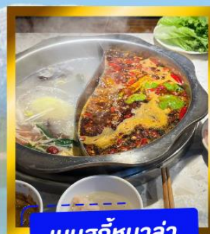
เมนูสุกี้หม่าล่า