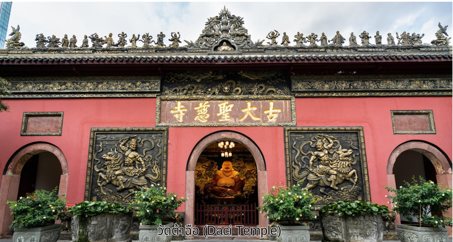
วัดต้าจื่อ (Daci Temple)

จากนั้นนำท่านเข้าเยี่ยมชม ศูนย์ผลิตภัณฑ้อัญมณีหยก หยกนับเครื่องประดับที่นิยมกันอย่างแพร่หลายตามความเชื่อของคนชาวจีนซึ่งมีมาตั้งแต่สมัยโบราณโดยเฉพาะความเชื่อเกี่ยวกับการใส่หยกเป็นเครื่องประดับจะช่วยเสริมให้มีอำนาจ ช่วยให้มีความสำเร็จก้าวหน้าและความเจริญรุ่งเรือง อีกทั้งยังช่วยสร้างสมดุลให้เกิดขึ้นได้ทั้งร่างกายและจิตใจ รวมไปถึงการช่วยเสริมพลังให้ร่างกายแข็งแรง จากนั้นเดินทางไปยัง วัดต้าจื่อ เป็นวัดเก่าแก่ที่มีอายุยาวนานกว่า 1,600 ปี ตั้งอยู่ใจกลางของ Chengdu ที่นี่ถือเป็นสถานที่สำคัญที่น่าสนใจ เพราะเป็นวัดที่พระถังซำจั๋งบวชเป็นพระภิกษุก่อนจะย้ายไปจำพรรษายังวัดอื่นภายในวัดต้าจื่อ นั้นเจียบสงบ