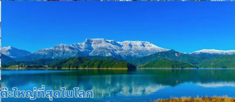
ภูเขาหิมะวาวู ภูเขาโต๊ะใหญ่ที่สุดในโลก