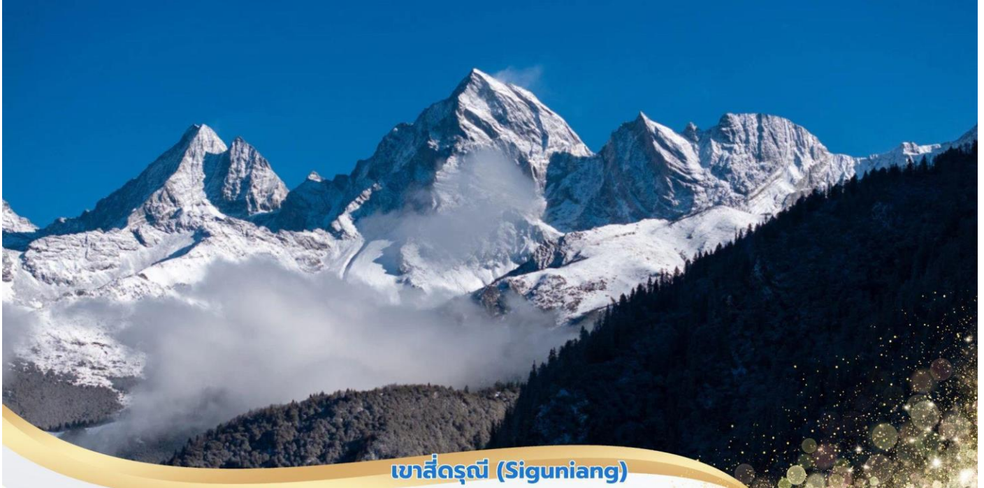
เขาสี่ดรุณี (Siguniang)

นำท่านเดินทางต่อสู่ เขตอุทยานภูเขาสี่ดรุณี (Siguniang) หรือชื่อเรียกเป็นภาษาจีนว่า ชื่อภูเขาหมื่นซาง ตั้งอยู่ในอุทยานฉางผิง เขตปกครองตนเองอาปา มณฑลเสฉวน ทางตะวันตกเฉียงใต้ของจีน มีเนื้อที่กว่า 2,000 ตารางกิโลเมตร ปัจจุบันได้รับการขึ้นทะเบียนเป็นอุทยานแห่งชาติระดับ 5A