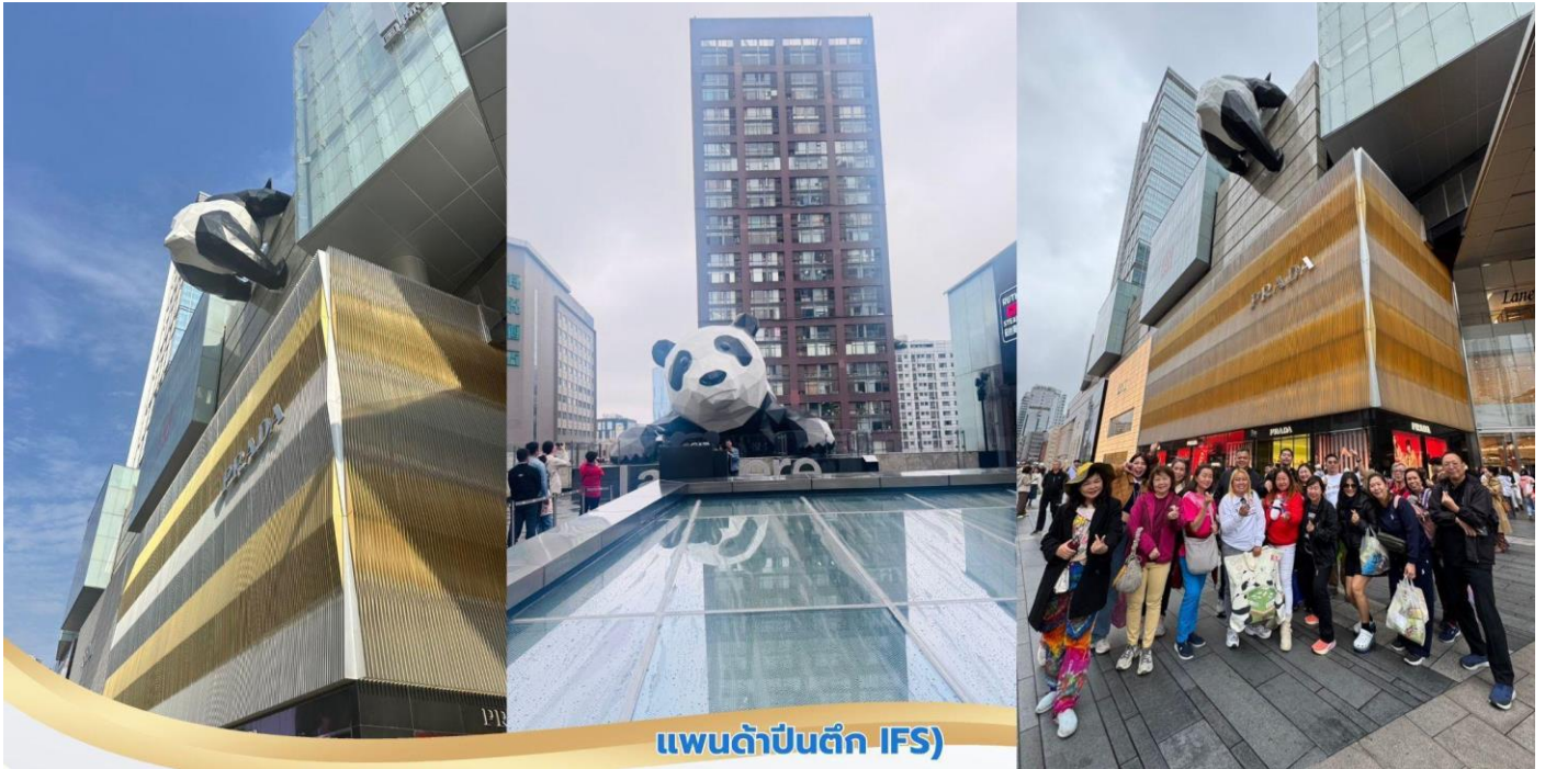
แพนด้าปั้นตึก (IFS)

บ่าย จากนั้นนำท่านสู่ ถนนคนเดินชุนซีลู่ เป็นย่านวัยรุ่นเปรียบได้กับสยามสแคว์ ซึ่งขายสินค้าที่ทันสมัย เป็นถนนที่ปิด ไม่ให้รถวิ่งผ่านได้ ห้างดังในย่านนี้มีให้เลือกช้อปปิ้งมากมายหลากหลาย จากนั้นนำท่านชม หมีแพนด้ายักษ์ กำลังปั้นตึก IFS เป็นอีกหนึ่งแลนด์มาร์ค ที่ใครมาเจ็ดดูแล้วต้องมาเช็กอิน หรือ เลือกช้อปปิ้ง ไอเท็มสุดฮิตที่ร้าน POP MART สายสะสมน้อง Labubu ไม่ควรพลาด