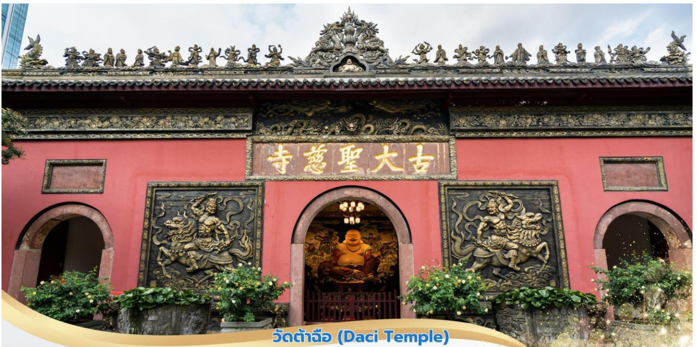
วัดต้าจื่อ (Daci Temple)

จากนั้นนำท่านเดินทางสู่ เมืองเจิงตุ๋ ให้ท่านพักผ่อนชมวิวทิวทัศน์ที่สวยงามระหว่างสองข้างทาง จากนั้นเดินทางไปยัง วัดต้าจื่อ เป็นวัดเก่าแก่ที่มีอายุยาวนานกว่า 1,600 ปี ตั้งอยู่ใจกลางของเจิงตุ๋ ที่นี่ถือเป็นสถานที่สำคัญที่น่าสนใจ เพราะเป็นวัดที่พระถังซำจั๋งบวชเป็นพระภิกษุก่อนจะย้ายไปจำพรรษายังวัดอื่นภายในวัดต้าสือนั้นเจียบสงบ