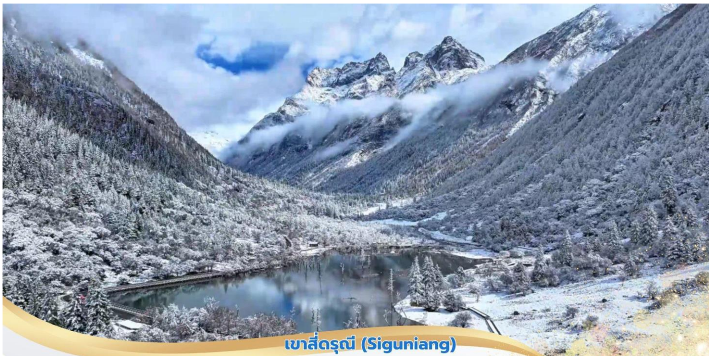
เขาสีดรุณี (Siguniang)

คำ บริการอาหารค่ำ ณ ภัตตาคาร ที่พัก XIQIANG HOMELAND HOTEL ระดับ 4* หรือเทียบเท่า