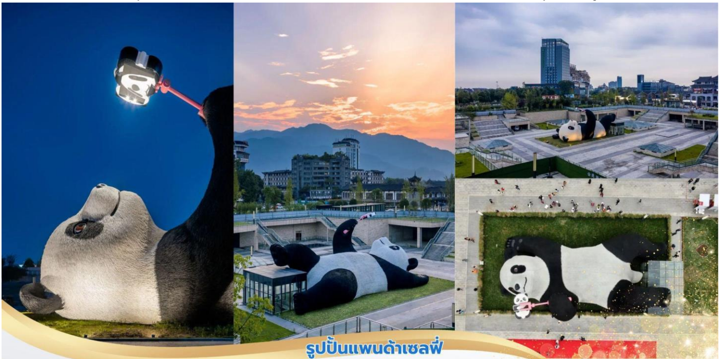
รูปปั้นแพนด้าเซลฟ์

จากนั้นนำท่านสู่ จตุรัสหย่างเทียนวู ที่เชื่อมตูเจียงเยี่ยนได้เปิดต่อสาธารณชนอย่างเป็นทางการ ชมรูปปั้นผลงานศิลปะ แพนด้าเซลฟ์ รูปลักษณะที่น่ารักของประติมากรรมชิ้นนี้ดึงดูดนักท่องเที่ยวจำนวนมากให้มา “เช็กอิน” “แพนด้า” มีความน่ารักน่าเอ็นดูมาก นักออกแบบ แนะนำว่าผลงานแพนด้ามีความสุข ด้วยท่าทางสบายๆ ผ่อนคลายและมีความสุข และเป็นการแสดงออกด้วยภาษาทางศิลปะแบบหนึ่งที่มีมอบความสุขให้กับผู้พบเห็น