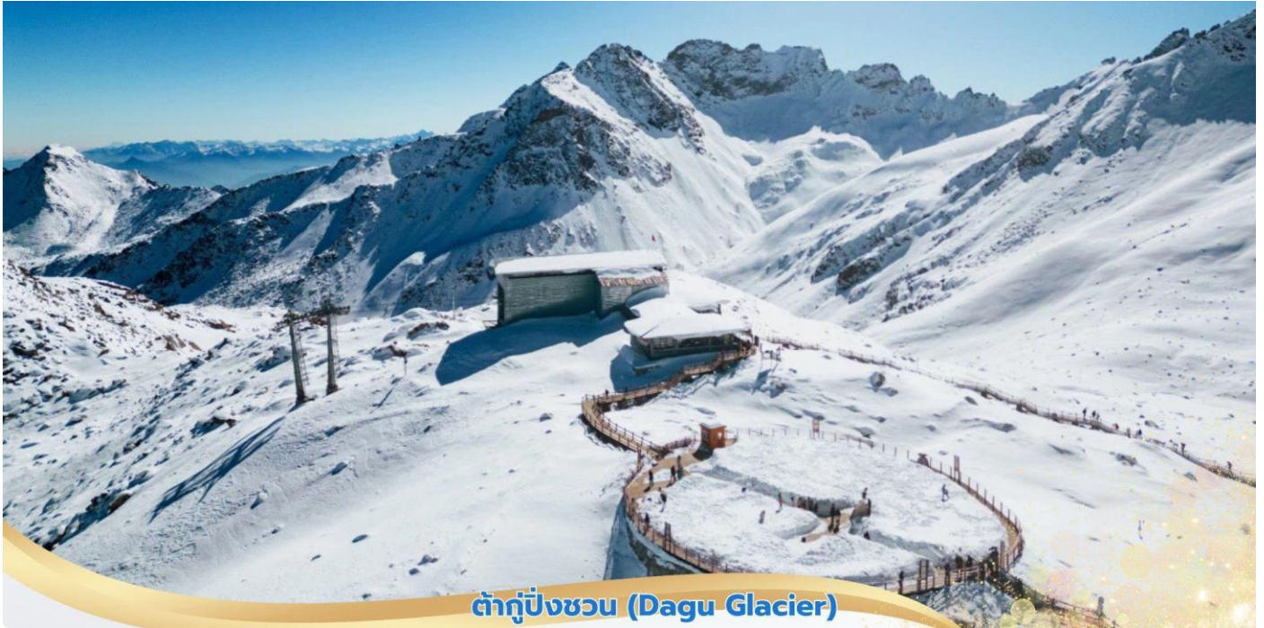
ต้ากู่ปิ่งชว่น (Dagu Glacier)

บ่าย นำท่านชมทิวทัศน์ของภูเขาและทะเลสาบเชิงเขา จากนั้นนำท่านนั่งกระเช้าคอนโดล่า 6 - 8 ที่นั่ง มีระยะทาง 1,226 เมตร ขึ้นไปที่ความสูง 3,400 เมตรจากระดับน้ำทะเล ชมภูเขาหิมะ 3 ลูก ที่เชื่อว่าเป็นสันหลังมังกรที่มีความงามที่เป็นภูเขาหิมะสีขาว ตัดกับท้องฟ้าสีครามสดใส