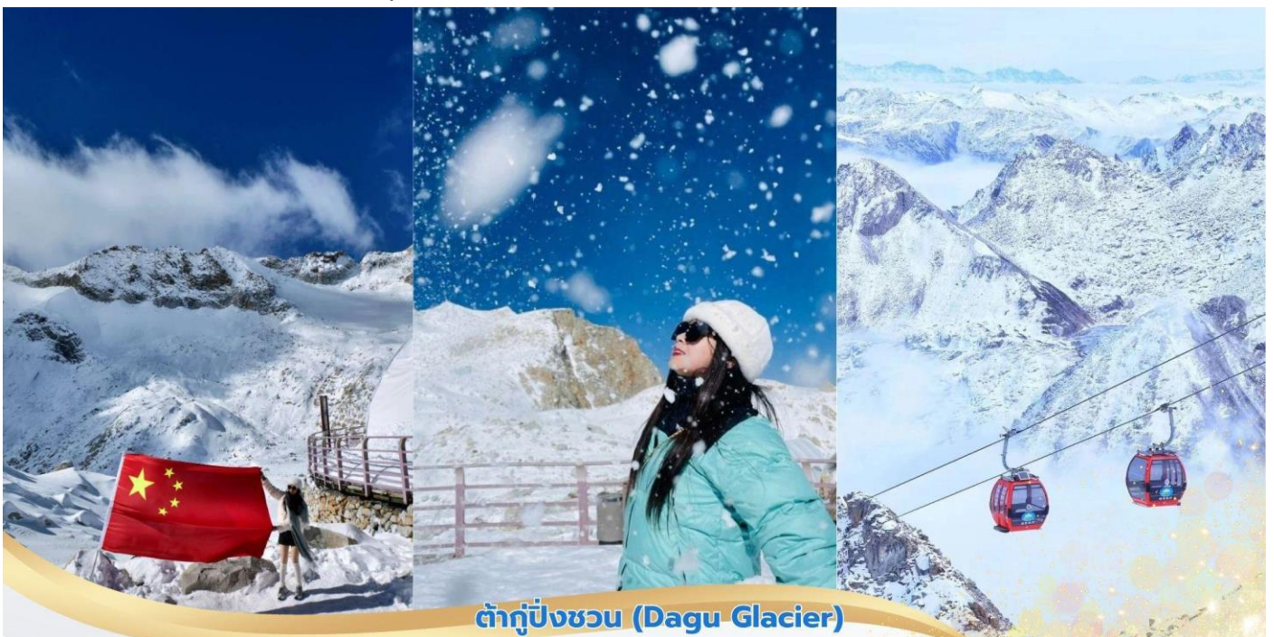
ต้ากู่ปิ่งชว่น (Dagu Glacier)

พาท่านชมทะเลสาบต้ากู่ หรืออีกชื่อ ทะเลสาบน้ำมนต์ขอฟพ ซึ่ง มีเรื่องราวเล่าขานของชนเผ่าชาวพื้นเมืองว่าหากมีเรื่องร้อนใจให้กราบไหว้เทพเจ้าที่คุ้มครองทะเลสาบแห่งนี้ จะทำเรื่องร้อนใจคลายลง หรือใครขอฟพต่อเทพเจ้าคุ้มครองทะเลสาบแห่งนี้ก็จะสมหวังดังที่ขอฟพไว้ทำให้ทะเลสาบแห่งนี้ถือเป็นทะเลสาบที่มีความสำคัญมากและมีประวัติความเป็นมาที่ยาวนานกว่า 1,000 ปี