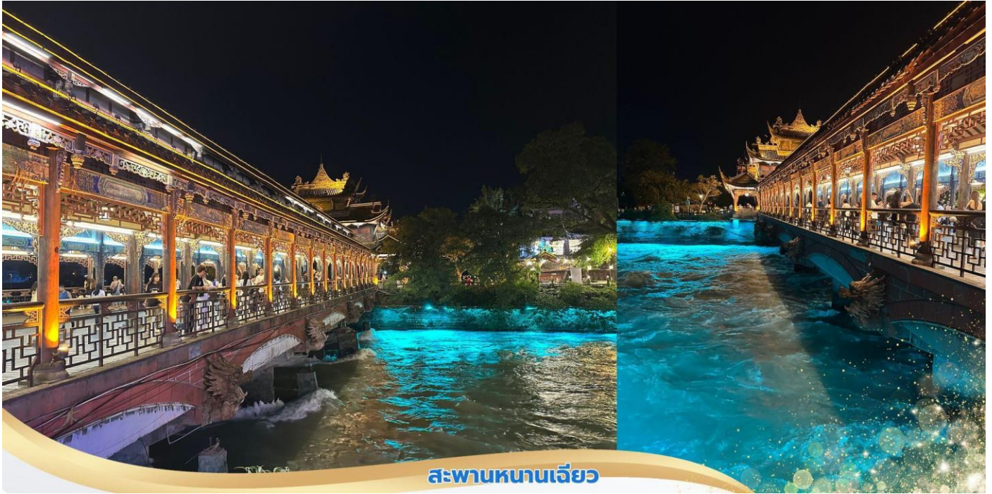
สะพานหนานเจียว

*หมายเหตุ การเกิด "น้ำตาสีฟ้า" ขึ้นอยู่กับปัจจัยหลายประการ ทำให้ไม่สามารถรับประกันได้ว่าจะได้เห็นปรากฏการณ์นี้ทุกครั้งที่ไม่เยือน ทั้งนี้ ท่านยังสามารถได้ชมประดับไฟอย่างสวยงามและมีการแสดงแสงสีเสียงที่สะพานในยามค่ำคืน