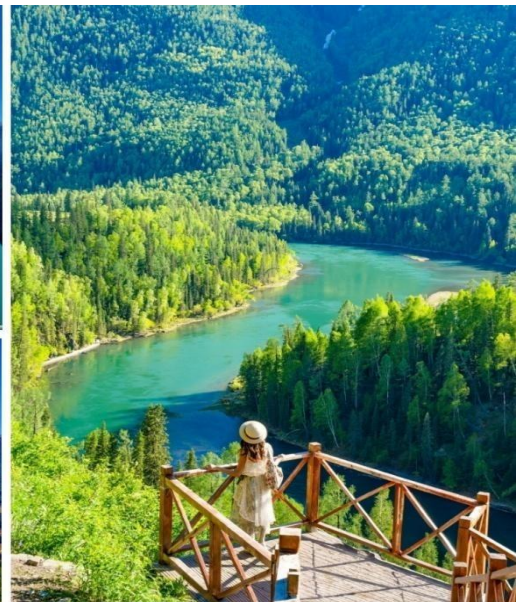
อุทยานแห่งชาติคานาส

คำ บริการอาหารคำ ณ ภัตตาคาร ที่พัก Hongbai Hualin Hotel ระดับ 4* หรือเทียบเท่า