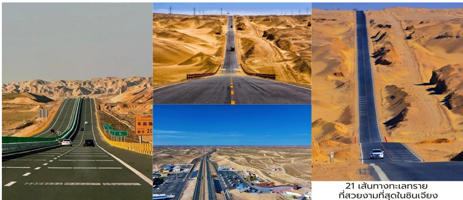
S21 เส้นทางทะเลทรายที่สวยงามที่สุดในซินเจียง

นำท่านเดินทางสู่ เมืองบูร์จิน (Burqin, 布尔津) ผ่านทางหลวงหมายเลข S21 เส้นทางทะเลทรายที่สวยงามที่สุดในซินเจียง ถือเป็นหนึ่งเส้นทางที่งดงามและน่าทึ่งที่สุดของเขตปกครองตนเองซินเจียง เส้นทางนี้ทอดยาวกว่า 520 กิโลเมตร ใช้เวลาเดินทางโดยรถยนต์ประมาณ 6 ชั่วโมงครึ่ง ผ่านภูมิประเทศอันหลากหลายจากภูเขาสูง หุบเขา ไปจนถึงทะเลทรายอันเว้งว่าง ถนน S21 ตัดผ่านภูมิประเทศทะเลทรายกว้างใหญ่ตระการตา สีทองของผืนทรายตัดกับฟ้าสีครามราวภาพวาด บางช่วงสามารถมองเห็นเนินทรายที่ทอดยาวสุดลูกหูลูกตาเป็นจุดถ่ายภาพยอดนิยมสำหรับนักเดินทางสาย Road Trip