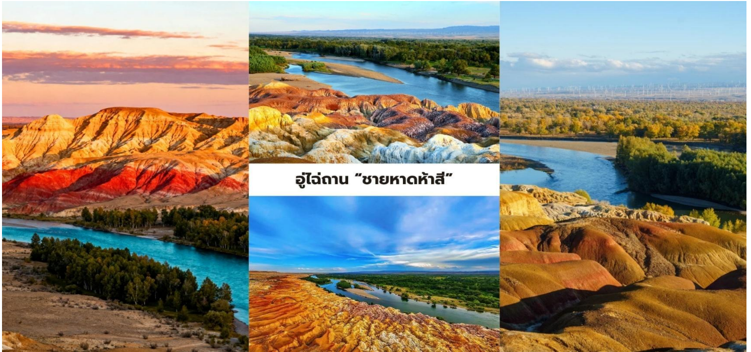
อุโมงค์ถ้ำ "ชายหาดห้าสี"

คำ บริการอาหารคำ ณ ภัตตาคาร ที่พัก Shang Shi International Hotel ระดับ 4* หรือเทียบเท่า