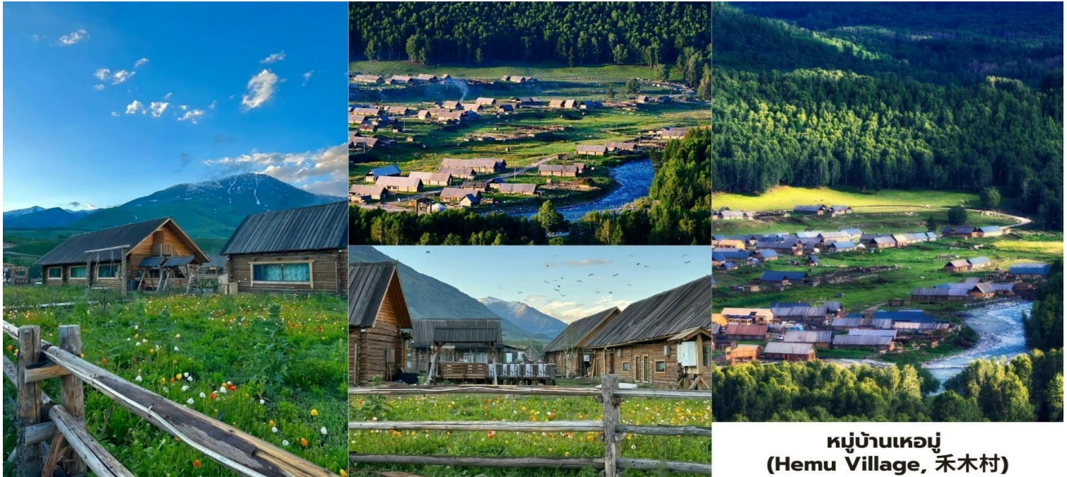
หมู่บ้านเหมอู่ (Hemu Village, 禾木村)