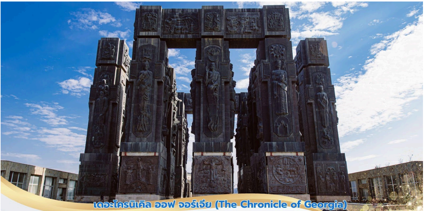
เดอะไครนิเคิล ออฟ จอร์เจีย (The Chronicle of Georgia)

นำท่านชม เดอะไครนิเคิล ออฟ จอร์เจีย (The Chronicle of Georgia) เสาหินสลักศิลปกรรม แบบเปอร์เซีย ขนาดใหญ่ จำนวน 16 ต้น ตั้งอยู่บนภูเขาสูงเป็นจุดชมวิวมืองมูมสูงที่สวยงาม สะท้อนถึงประวัติศาสตร์ของจอร์เจียและผู้ปกครองรวมถึงจากทางศาสนา เสาแต่ละต้นมีขนาดถึง 10 คนโอบ มีความสูงถึง 35 เมตร ซึ่งเสาแต่ละต้นได้บันทึกเรื่องราวทางประวัติศาสตร์ของ ประเทศจอร์เจียเอาไว้ในรูปแบบของงานจิตรกรรมปูนต่อนุสาวรีย์เป็นที่รู้จักกันว่าเป็นอนุสรณ์สถานทางประวัติศาสตร์ของจอร์เจีย ถูกสร้างขึ้นโดยจิตรกรประติมากรชาวจอร์เจีย – รัสเซียและสถาปนิก ชื่อ Zurab Tsereteli อนุสรณ์ถูกสร้างขึ้นเพื่อเฉลิมฉลอง 3,000 ปี การได้มาซึ่งอำนาจอธิปไตยของ ชาวจอร์เจียและในวาระ 2,000 ปี แห่งการแผ่ขยายของศาสนาคริสต์นิกายออร์ทอดอกซ์ในจอร์เจีย