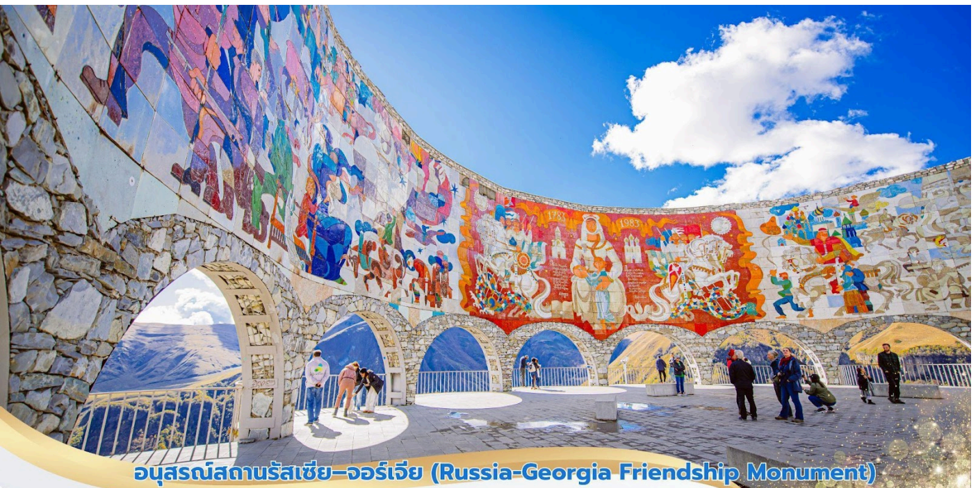
อนุสรณ์สถานรัสเซีย-จอร์เจีย (Russia-Georgia Friendship Monument)

จากนั้นนำท่านเดินสู่เมือง Stepantsminda จากนั้นนำท่านเปลี่ยนเป็น รถออฟโรด (4X4 ขับเคลื่อน 4 ล้อ) นั่งคันละไม่เกิน 6 ท่าน ขึ้นสู่ยอดเขาคาสเบกิ ใช้เวลาเดินทางประมาณ 15 นาที เมื่อเดินทางไปยังบริเวณจุดจอดรถ ภาพเบื้องหน้าของทีคือ โบสถ์เทอริเกตี (Gergeti Trinity Church) โบสถ์เก่าแก่ที่สร้างขึ้นในยุคกลาง ด้วยความศรัทธาอย่างเต็มเปี่ยม อายุกว่า 600 ปี ตั้งอยู่บนความสูงจากระดับน้ำทะเล 2,170 เมตร ผู้มาเยือนต่างขนานนามว่า โบสถ์เทอริเกตี เป็นหนึ่งในโบสถ์ที่สวยงาม