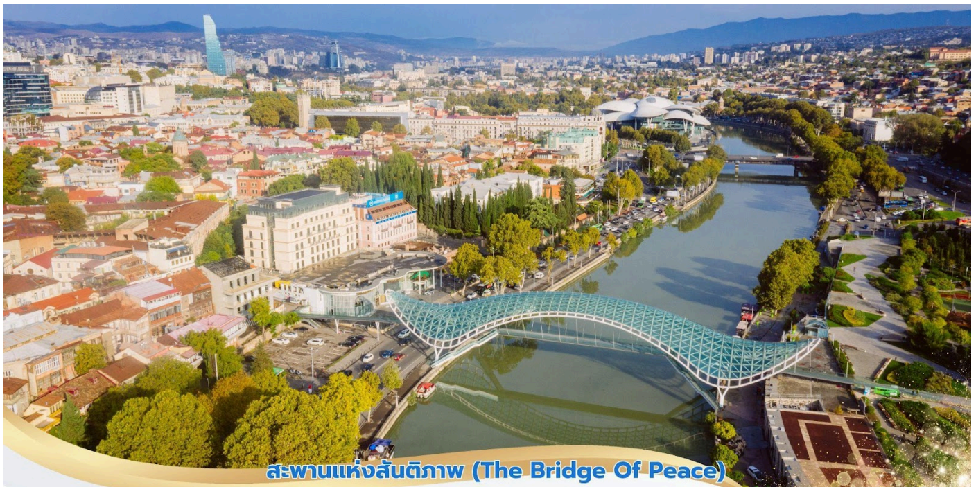
สะพานแห่งสันติภาพ (The Bridge Of Peace)

(ปีค.ศ.1089-1125) ได้มีการสร้างเพิ่มเติมขึ้นอีก ซึ่งต่อมาเมื่อพวกมองโกลได้เข้ามายึดครอง ก็ได้เรียกชื่อ ป้อมแห่งนี้ว่า นาริน กาลา (Narin Qala) ซึ่งมีความหมายว่า ป้อมเล็กชมรูปปั้น Mother of a Georgia หรืออีกชื่อหนึ่งคือ Kartlis Deda เป็นรูปปั้นหญิงสาวสูง 20 เมตรบนยอดเขาโซโล ลากิ (Solo Laki Hill) ในนครทบิลีซี โดยรูปปั้นนี้สร้างขึ้นในปี ค.ศ. 1958 เพื่อฉลองนครทบิลีซีอายุ ครบ 1,500 ปี และเป็นรูปปั้นที่สะท้อนถึงจิตวิญญาณและนิสัยของคนจอร์เจียได้เป็นอย่างดี มือข้าง หนึ่ง ของรูปปั้นจะถือดาบ ส่วนมืออีกข้างหนึ่งจะถือแก้วไวน์ ซึ่งมีความหมายว่าหากใคร ที่มาเยือน จอร์เจีย แบบศัตรูเราจะใช้ดาบในมือขวาฟาดฟันให้แตกดินแต่หากใครที่มาเยือนอย่างเป็นทางการ เป็นมิตร เราจะต้อนรับ ด้วยไวน์ในมือซ้ายอย่างอบอุ่นและอิมหน้าสำราญ จากนั้นนำท่านสู่ สะพานแห่งสันติภาพ (The Bridge Of Peace) อีกหนึ่งงานสถาปัตยกรรมที่น่าสนใจในเมืองทบิลีซีออกแบบโดย สถาปนิกชาวอิตาลีชื่อ Michele De Lucchi สะพานมีความยาวที่ 150 เมตร ลักษณะการออกแบบร่วมสมัยเปิด อย่าง เป็นทางการเมื่อวันที่ 6 พฤษภาคม 2010 โครงสร้างนั้นถูกออกแบบและสร้างที่ประเทศอิตาลี และนำเข้าส่วนประกอบ โดยรถบรรทุกมากกว่า 200 คัน เพื่อเข้ามาติดตั้งในเมืองทบิลีซี ที่ตั้งนั้นอยู่ บน แม่น้ำมตควารี (Mtkvari River) สามารถมองเห็นได้หลายมุมจากในเมือง