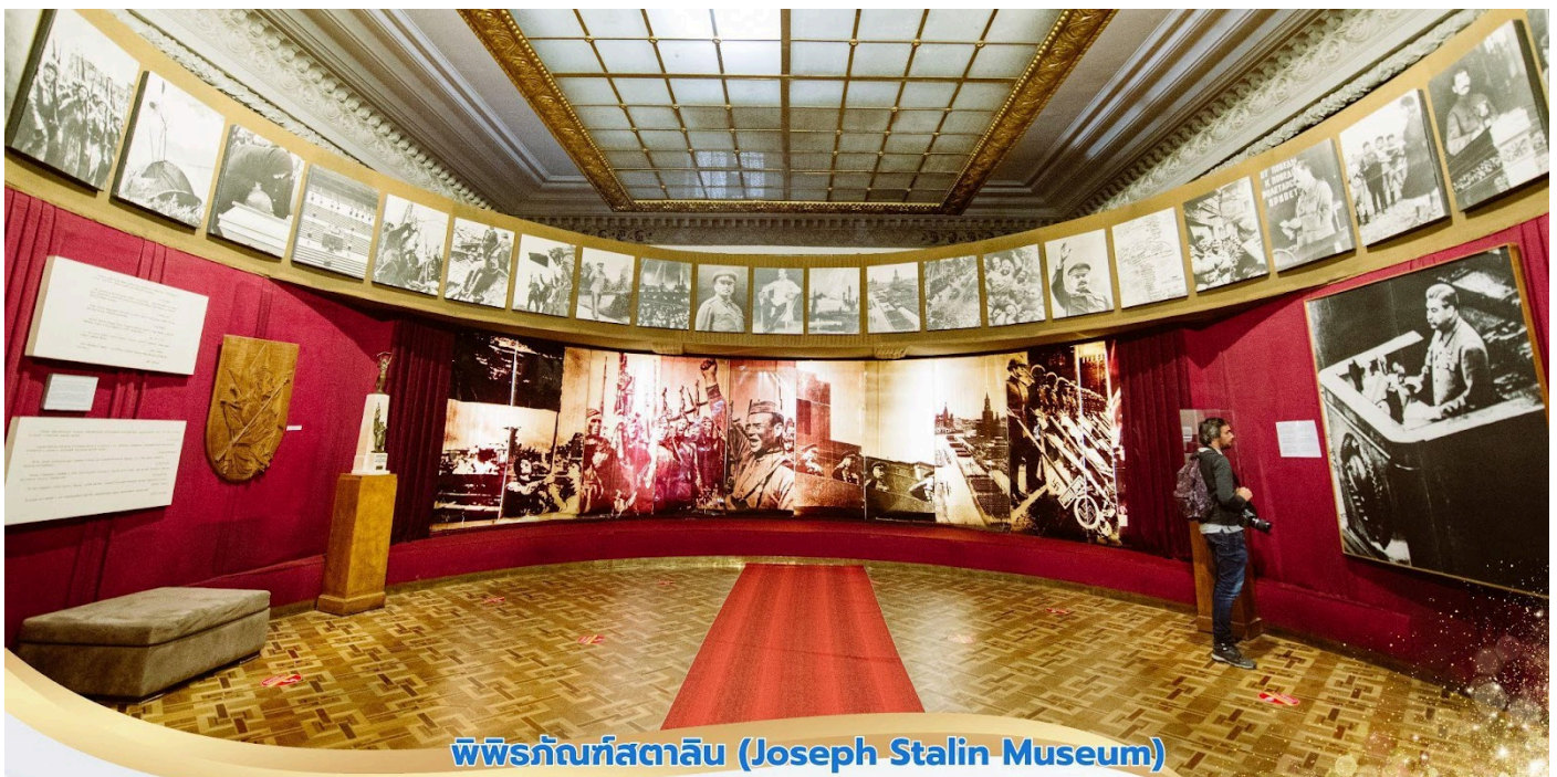
พิพิธภัณฑ์สตาลิน (Joseph Stalin Museum)

นำท่านชม พิพิธภัณฑ์สตาลิน (Joseph Stalin Museum) ผู้นำคนสำคัญของพรรค บอลเชวิค พิพิธภัณฑ์สตาลิน เป็นพิพิธภัณฑ์อย่างเป็นทางการแห่งเดียวในโลกที่ระลึกถึงสตาลิน ประกอบด้วยห้องจัดแสดงนิทรรศการ 7 ห้อง นับตั้งแต่เกิดจนเติบโต จนนำไปสู่การขึ้นเป็นผู้นำ ของพรรคบอลเชวิค ในกลุ่มประเทศสหภาพโซเวียต ภาพต่างๆ