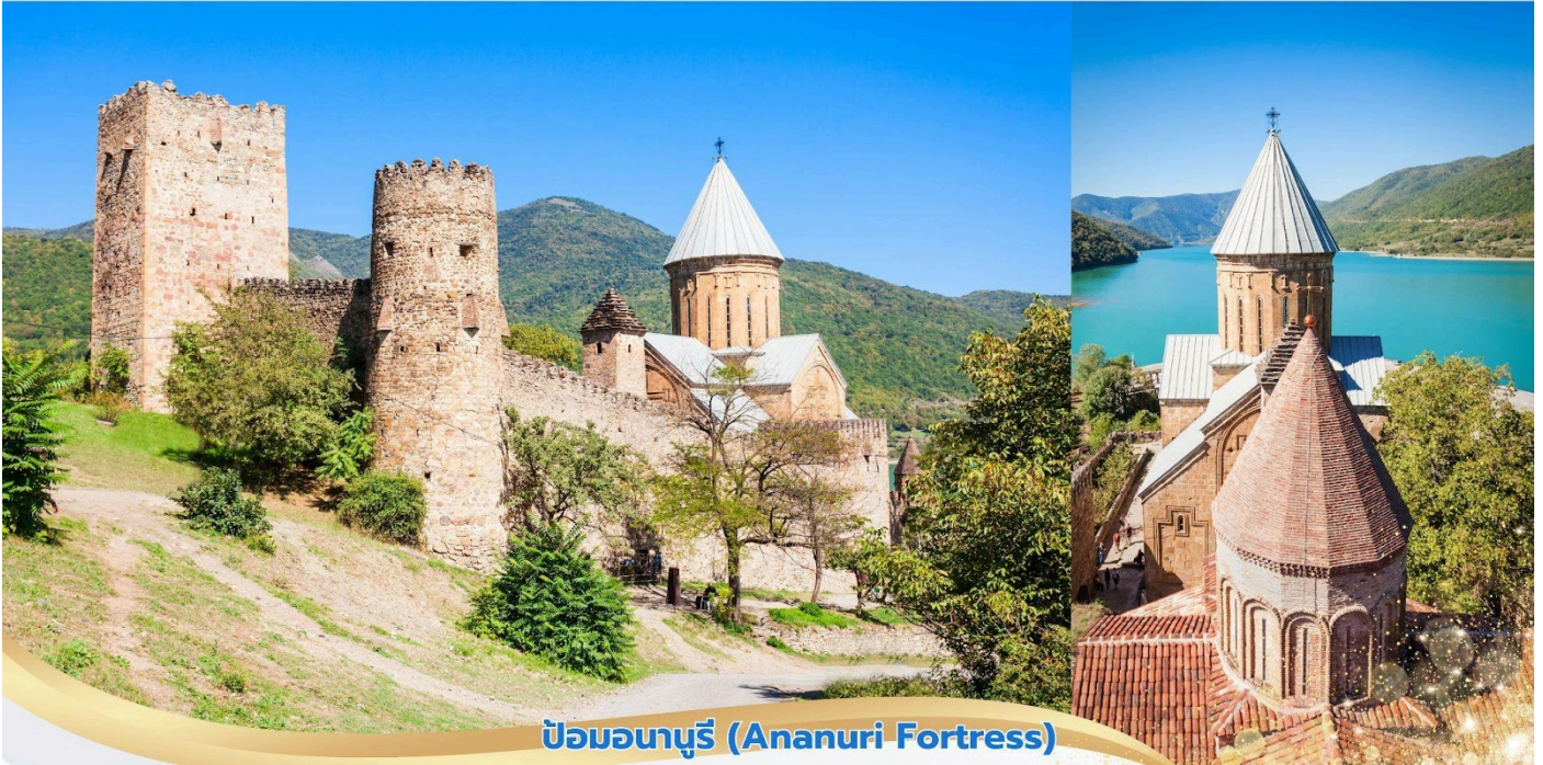
ป้อมอนูรี (Ananuri Fortress)

จากนั้นนำท่านเดินสู่เมือง Stepantsminda นำท่านแวะชม อนุสรณ์สถานรัสเซีย-จอร์เจีย (Russia-Georgia Friendship Monument) อนุสรณ์สถานหินโค้งวงแหวนขนาดใหญ่ สร้างขึ้นในปี 1983 เพื่อเฉลิมฉลองครบรอบ 200 ปี ของสนธิสัญญาจอร์จีเยฟสกี (Treaty of Georgievski) และแสดงถึงความสัมพันธ์ระหว่างสหภาพโซเวียตกับจอร์เจีย