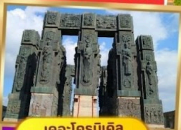
เดอะโครนิเคิล ออฟ จอร์เจีย