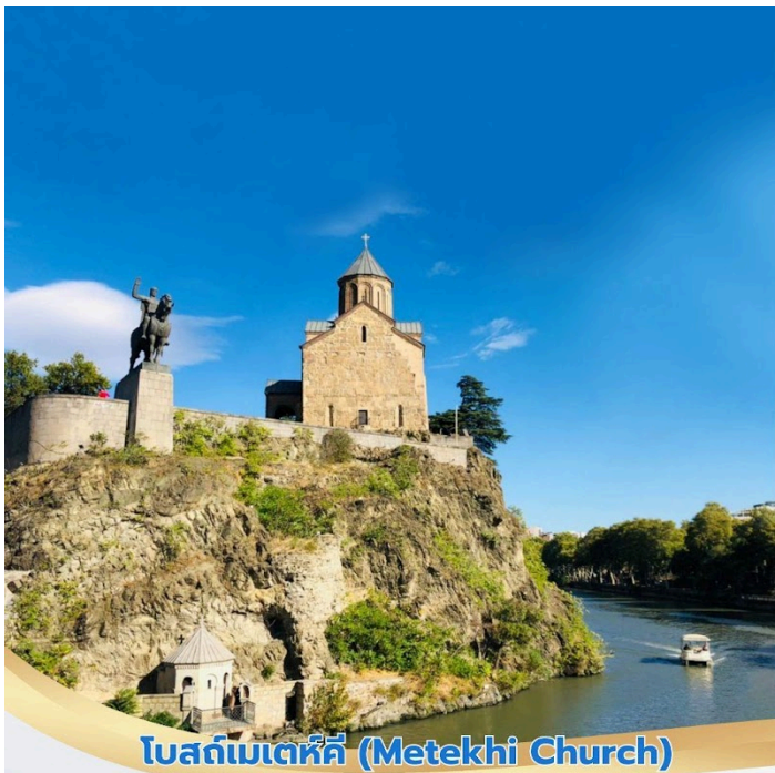
โบสถ์เมเทห์คี (Metekhi Church)

เปิดประตูออกมาทักทายผู้คนที่ระเบียง และใช้ก้อนคูใจที่ระบังบอกเวลาอีกจุดไฮไลต์ ไม่ควรพลาด สำหรับการเดินเที่ยวในกรุงทบิลีซี จากนั้นนำท่านชมภายนอก โรงอาบน้ำแร่เก่าแก่ (Bath Houses) ที่มีชื่อเสียงในเรื่องบ่อน้ำร้อนกำมะถันธรรมชาติ จากนั้นนำท่านชม โบสถ์เมเทห์คี (Metekhi Church) โบสถ์ที่มีประวัติศาสตร์อยู่บ้านคูเมืองของทบิลีซี ตั้งอยู่บริเวณริมหน้าผาของแม่น้ำมทวารี เป็นโบสถ์หนึ่งทีสร้างอยู่ในบริเวณทีมีประชากรอาศัยอยู่ ซึ่เป็นประเพณีโบราณทีมีมาแต่ก่อน กษัตริย์วาคตัง ที 1 แห่งจอร์กาซาลี ได้สร้างป้อมและโบสถ์ไว้ทีบริเวณนี้