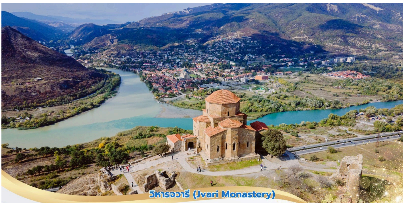
วิหารจวารี (Jvari Monastery)

นำท่านชม วิหารสเวตีสเคอเวรี (Svetitkhoveli Cathedral) ซึ่งคำว่า Sveti หมายถึง "เสา" และ Tskhoveli หมายถึง "ชีวิต" โดยความหมายรวมกัน หมายถึงวิหารเสาที่มีชีวิต โบสถ์แห่งนี้ถือเป็นศูนย์กลางทางศาสนาที่ศักดิ์สิทธิ์ที่สุดของจอร์เจีย สร้างขึ้นโดยสถาปนิกชาวจอร์เจีย มีขนาดใหญ่เป็นอันดับสองของประเทศ อีกทั้งยังเป็นศูนย์กลางที่ทำให้ชาวจอร์เจียเปลี่ยนความเชื่อและหันมานับถือศาสนาคริสต์