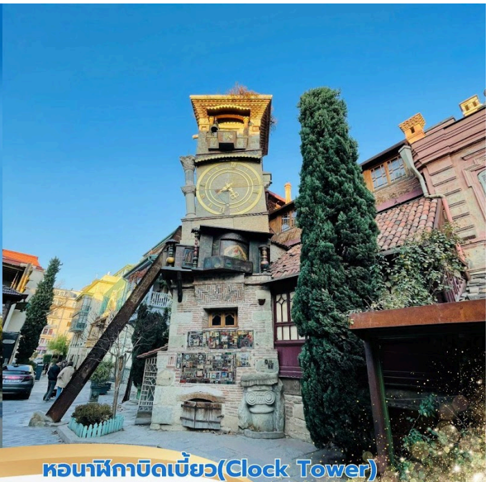
หอนาฬิกาบิดเบี้ยว(Clock Tower)

จากนั้นนำท่านขึ้นกระเช้าไฟฟ้าสู่ ป้อมนาริกาล่า (Narikala Fortress) ชมป้อมปราการซึ่ เป็นป้อมโบราณ สร้างในราวศตวรรษที 4 ในรูปแบบของซุริสทกซิค และต่อมาในราวศตวรรษที 7 สมัยของราชวงศ์อูมัยยาดได้มีการก่อสร้างต่อขยายออกไปอีก และต่อมาในสมัยของกษัตริย์ เดวิด