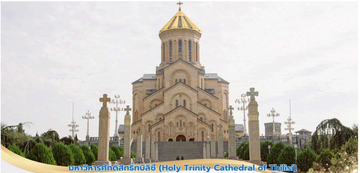
มหาวิหารศักดิ์สิทธิ์ทบิลีซี (Holy Trinity Cathedral of Tbilisi)

คำ บริการอาหารค่ำ ณ ภัตตาคาร ที่พัก BIOGRAPHY HOTEL ระดับ 4* หรือเทียบเท่า