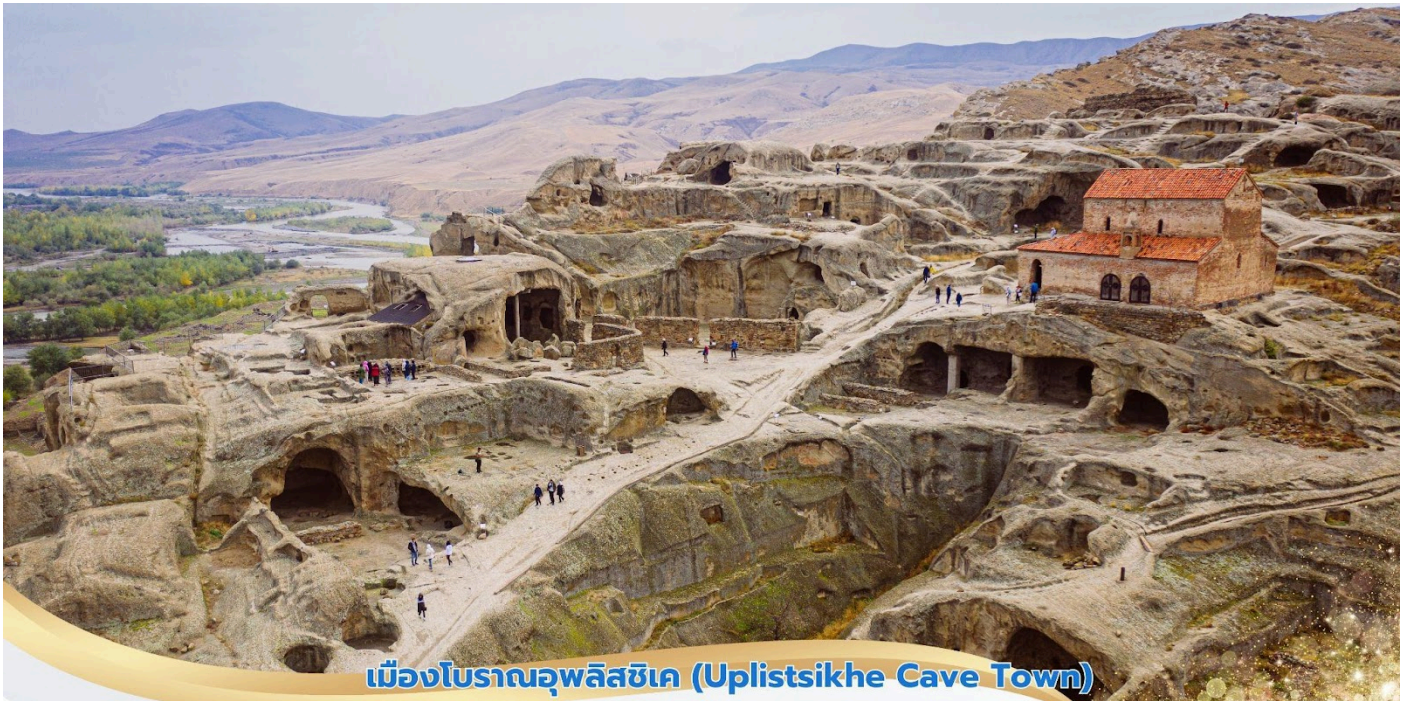
เมืองโบราณอูปลิสซิเค (Uplistsikhe Cave Town)

นำท่านแวะชม ศูนย์การค้า TBILISI MALL ให้ท่านได้อิสระช้อปปิ้งซื้อของฝาก อิสระอาหารค่ำตามอัธยาศัย