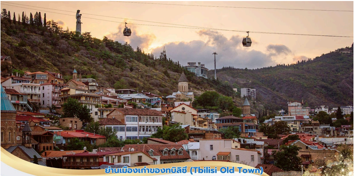
ย่านเมืองเก่าของทบิลีซี (Tbilisi Old Town)

นำท่านชม หอนาฬิกาบิดเบี้ยว(Clock Tower) เมื่อเข็มนาฬิกาไปชี้ที่เลข12 (XII) จะพบกับรูปปั้นนางฟ้า