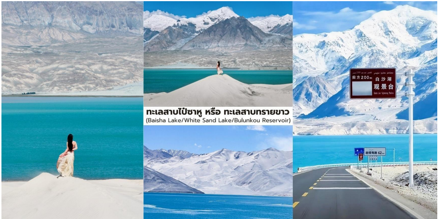
ทะเลสาบไปซาหู หรือ ทะเลสาบทรายขาว (Baisha Lake/White Sand Lake/Bulunkou Reservoir)

จากนั้นนำท่านเดินทางกลับสู่ เมืองคัชการ์ ระยะทางประมาณ 200 กิโลเมตร ใช้เวลาเดินทางราว 3.5 – 4 ชั่วโมง