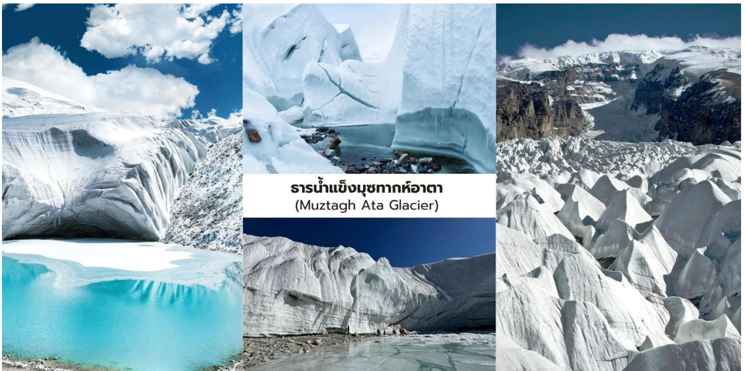
ธารน้ำแข็งมุขตากหืออาตา (Muztagh Ata Glacier)

จากนั้นนำท่านเดินทางต่อสู่ เมืองทาชเคอร์กัน (Tashkurgan) ระยะทางจากมุขตากหืออาตาประมาณ 50 กิโลเมตร ใช้เวลาเดินทางราว 1 ชั่วโมง อำเภอทาชเคอร์กันเป็นเมืองชายแดนที่ตั้งอยู่บนความสูงประมาณ 3,000 กว่าเมตรเหนือระดับน้ำทะเล ซึ่งเป็นเขตปกครองตนเองของชนเผ่าทาจิกและมีชาวทาจิกอาศัยอยู่เป็นประชากรส่วนใหญ่ของพื้นที่เมืองแห่งนี้ ด้วยความที่ตั้งอยู่ใกล้ชายแดนปากีสถาน ทาจิกิสถานและอัฟกานิสถานทำให้มีความสำคัญทั้งในด้านภูมิศาสตร์และวัฒนธรรมในอดีตพื้นที่แห่งนี้เคยเป็น จุดยุทธศาสตร์สำคัญบนเส้นทางสายไหม (Silk Road) ซึ่งใช้เป็นเส้นทางผ่านของพ่อค้าและนักเดินทางระหว่างจีนกับเอเชียกลาง ปัจจุบันแม้จะเป็นเมืองที่มีขนาดเล็ก แต่ก็ยังคงรักษาวัฒนธรรม วิถีชีวิตและเอกลักษณ์ของชนเผ่าทาจิกท่ามกลางภูมิประเทศของที่ราบสูงปามีร์ที่งดงามและเจียบสงบ เมืองทาชเคอร์กันจึงถือเป็นหนึ่งในเมืองชายแดนที่มีเอกลักษณ์ทางชาติพันธุ์และประวัติศาสตร์บนเส้นทางสายไหมที่สะท้อนถึงการผสมผสานของวัฒนธรรมจีนและเอเชียกลางได้อย่างน่าสนใจ.