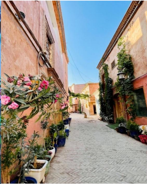
ถนนสายรุ้ง (Rainbow Alley)