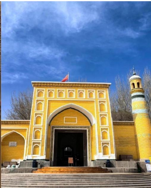
มัสยิดอิคกาห์ (Id Kah Mosque)