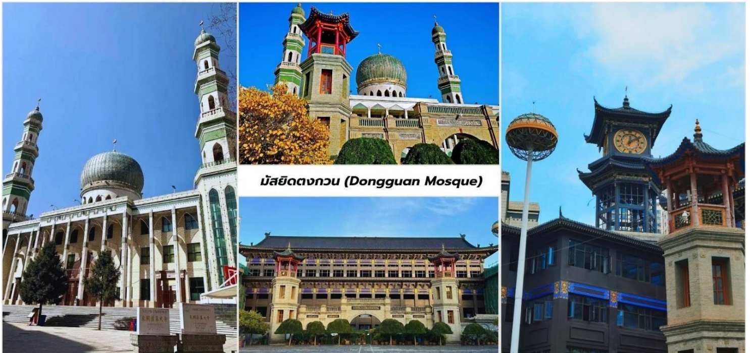
มัสยิดตงกวน (Dongguan Mosque)

จากนั้นนำท่านเที่ยวชมด้านนอก มัสยิดตงกวน (Dongguan Mosque) เป็นหนึ่งในมัสยิดที่ใหญ่และสำคัญที่สุดในประเทศจีน มีประวัติศาสตร์ยาวนานกว่า 600 ปีและเป็นศูนย์กลางของชุมชนมุสลิมในภูมิภาคนี้ โครงสร้างของมัสยิดสะท้อนถึงการผสมผสานระหว่างสถาปัตยกรรมจีนดั้งเดิมและสไตล์อิสลาม มัสยิดตงกวนมีความสำคัญต่อชุมชนมุสลิมในซีหนิงเป็นอย่างมาก เป็นศูนย์กลางทางศาสนาและวัฒนธรรม นอกจากนี้มัสยิดแห่งนี้ยังเป็นสัญลักษณ์ของความหลากหลายทางวัฒนธรรมในประเทศจีนและเป็นตัวอย่างของการอยู่ร่วมกันอย่างสันติสุขระหว่างชาวมุสลิมและชาวพุทธ