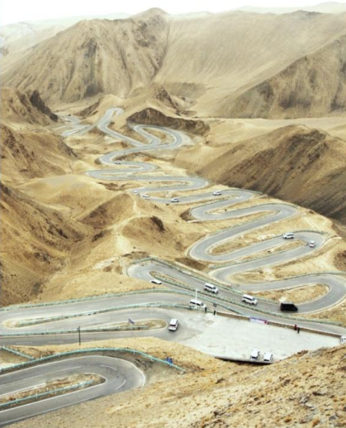
ถนนมังกรพันโค้ง/ผานหลง (Panlong Ancient Road)