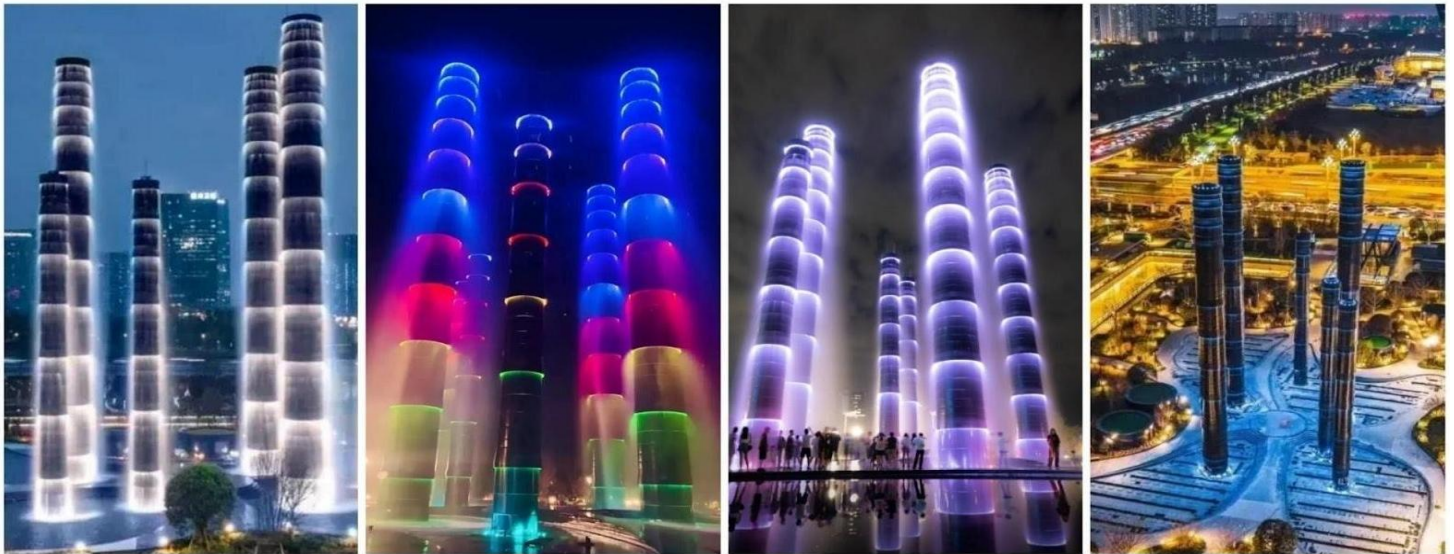
ชมแสงสี The Tower of Life

จากนั้นพาท่านไป ช้อปปิ้งที่ห้างหรู SKP แลนด์มาร์คที่ล้ำสมัยที่สุดในเมืองเฉิงตูเวลานี้ ห้างสรรพสินค้าลึกลับที่มิได้แค่ขายของแบรนด์เนมแต่คือการปฏิวัติวงการสถาปัตยกรรมด้วยคอนเซ็ปต์สวนสาธารณะบนดิน ห้างหรูใต้ดิน" บนพื้นที่รวมกว่า 5 แสนตารางเมตร ความพิเศษที่ทำให้ Chengdu SKP แตกต่างจากที่อื่นคือการสร้างห้างลึกลงไปใต้ดินถึง 5 ชั้น โดยที่พื้นที่ระดับพื้นดินถูกเปลี่ยนเป็นสวนสาธารณะสีเขียวขนาดใหญ่