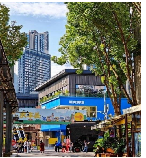
ตงเจียวจี้ (Eastern Suburb Memory)