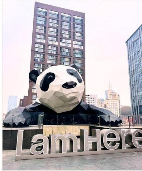
หมีแพนด้ายักษ์ กำลังป็นตึก IFS