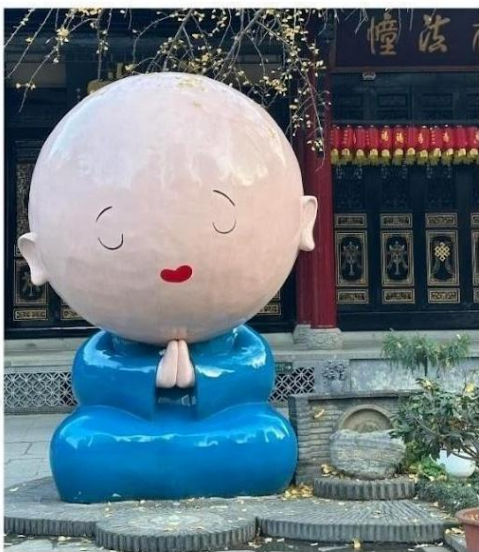
วัดต้าจื่อ

นำท่านสู่ ถนนคนเดินไท่กู๋หลี่ สัมผัสบรรยากาศแหล่งช้อปปิ้งสุดหรูที่ผสมผสานสถาปัตยกรรมแบบวัดโบราณกับตึกสมัยใหม่ได้อย่างลงตัว