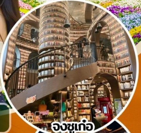
จงซูเก๋อ

สวนสวรรค์แห่งดอกไม้MANHUA-จงซูเก๋อ-จัดรู้อย่างเทียนวู-รูปปั้นแพนด้าเซลล์ เมืองโบราณกวนเซี่ยน-อุทยานเขาสีดรุณี(รวมรถอุทยาน)-สะพานหนานเจียว เมืองลั่วใต้-ตึกแฝด-SKP-วัดต้าจื่อ-ถนนคนเดินซุนซีลู่-IFS-ตงเจียวจี้-ถนนคนเดินไท่กุหลี่