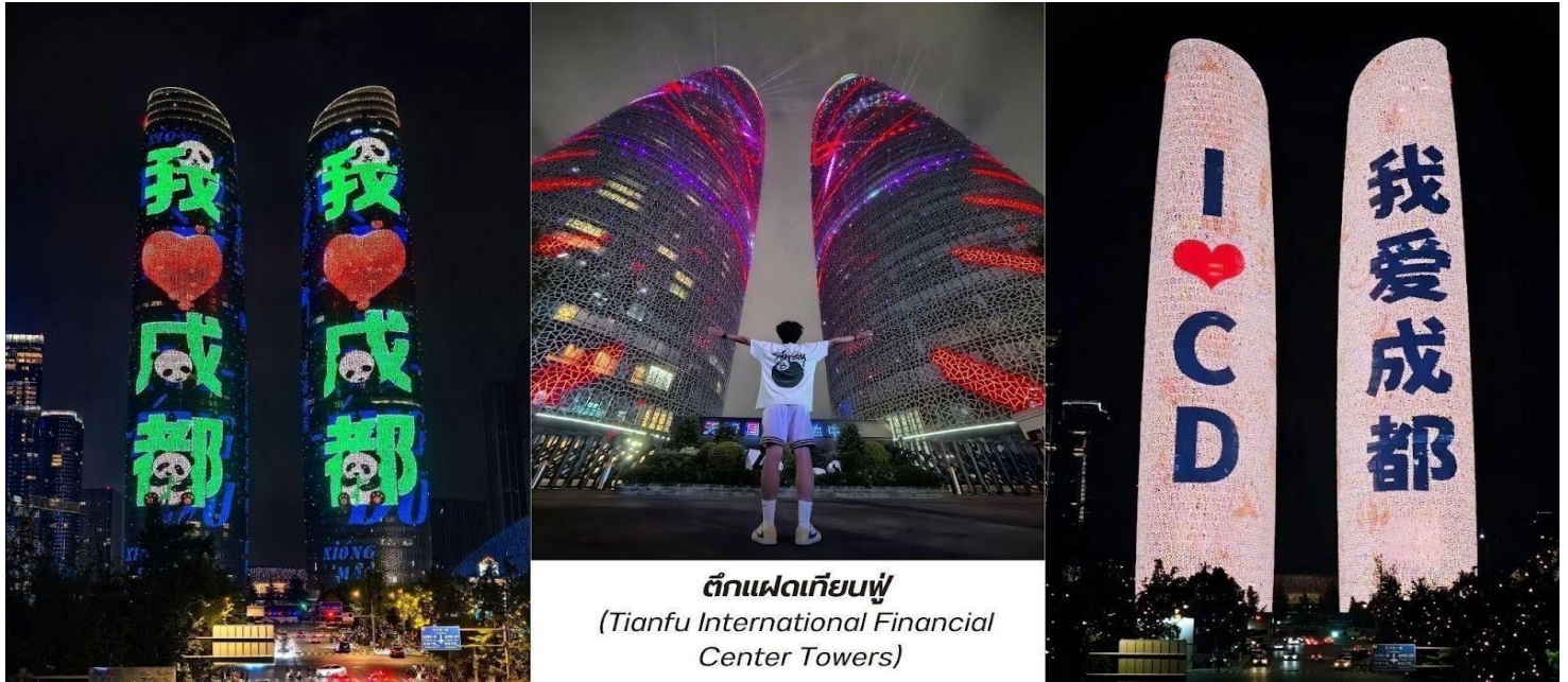
ตึกแฝดเทียนฟู (Tianfu International Financial Center Towers)

จากนั้นพาท่านไป ช้อปปิ้งที่ห้างหรู SKP แลนด์มาร์คที่ล้ำสมัยที่สุดในเมืองเฉิงตูเวลานี้ ห้างสรรพสินค้าลึกลับที่มิได้แค่ขายของแบรนด์เนมแต่คือการปฏิวัติวงการสถาปัตยกรรมด้วยคอนเซ็ปต์สวนสาธารณะบนดิน ห้างหรูใต้ดิน" บนพื้นที่รวมกว่า 5 แสนตารางเมตร ความพิเศษที่ทำให้ Chengdu SKP แตกต่างจากที่อื่นคือการสร้างห้างลึกลงไปใต้ดินถึง 5 ชั้น โดยที่พื้นที่ระดับพื้นดินถูกเปลี่ยนเป็นสวนสาธารณะสีเขียวขนาดใหญ่